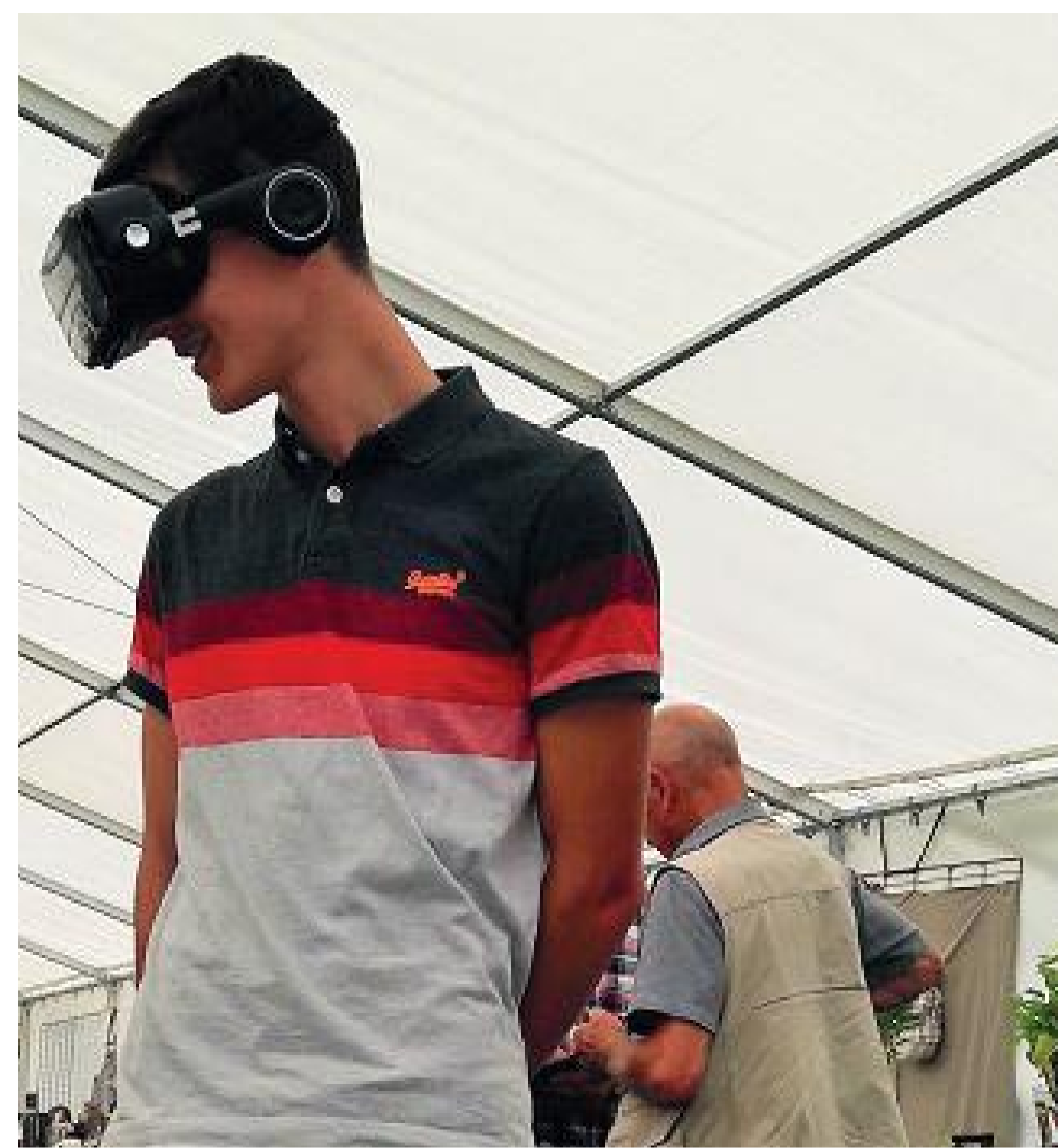
Visite virtuelle d'une éolienne

3) poursuivre le travail sur les mesures compensatoires et d'accompagnement.